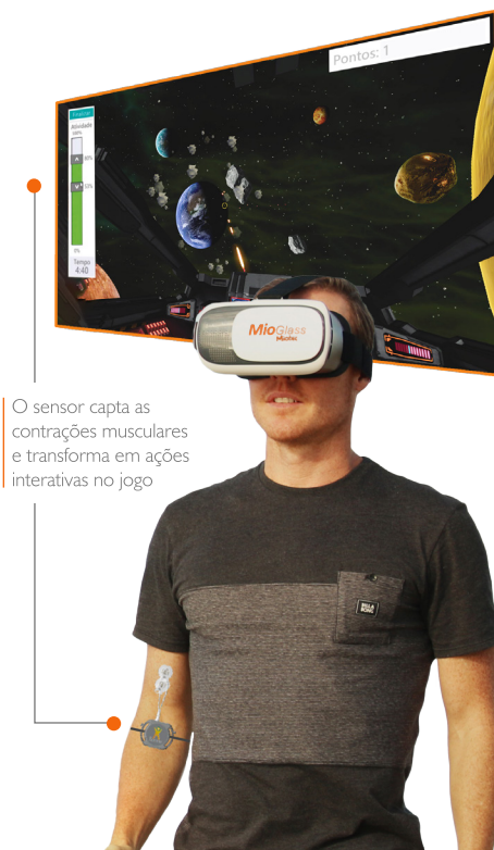
O sensor capta as contrações musculares e transforma em ações interativas no jogo

Enquanto o usuário interage com o jogo o profissional de saúde pode acompanhar visualmente o seu desempenho, avaliar ou mesmo alterar o protocolo do exercício em tempo real através de um software instalado em um computador.